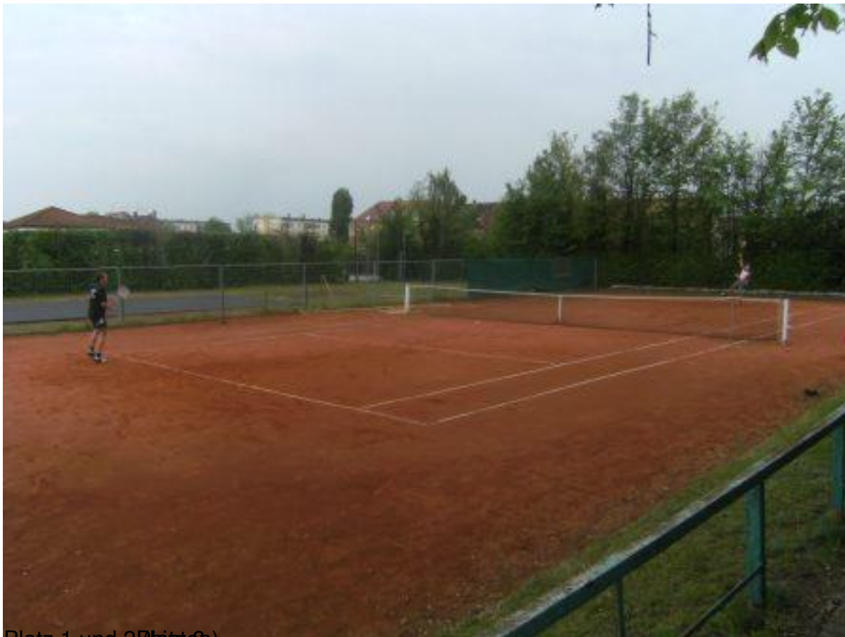
Platz 1 und 2 (Platz 2)